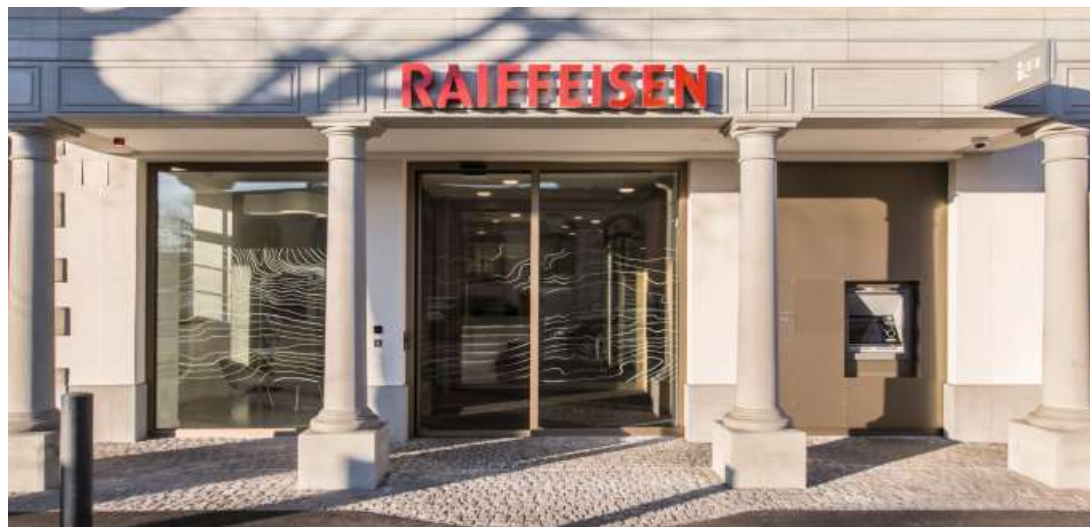
Die neu gestaltete Eingangsfront mit den grossflächigen Verglasungen und den bronzenfarbenen Metallprofilen wirkt offen und einladend.

RLC Architekten AG Stefan Räbsamen und Rolf Sager