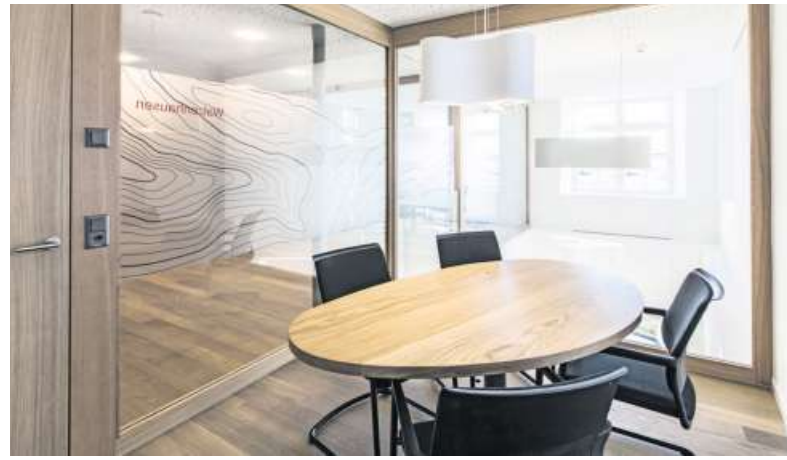
Repräsentative und atmosphärisch angenehme Besprechungsräume sind sowohl im Erd- als auch im Obergeschoss eingerichtet worden.

In der Aussenerscheinung wurde das Gebäude sorgsam und subtil bearbeitet. Der in den 1980er-Jahren rekonstruierte Sandstein Portikus mit Sandsteinsäulen, Archi-