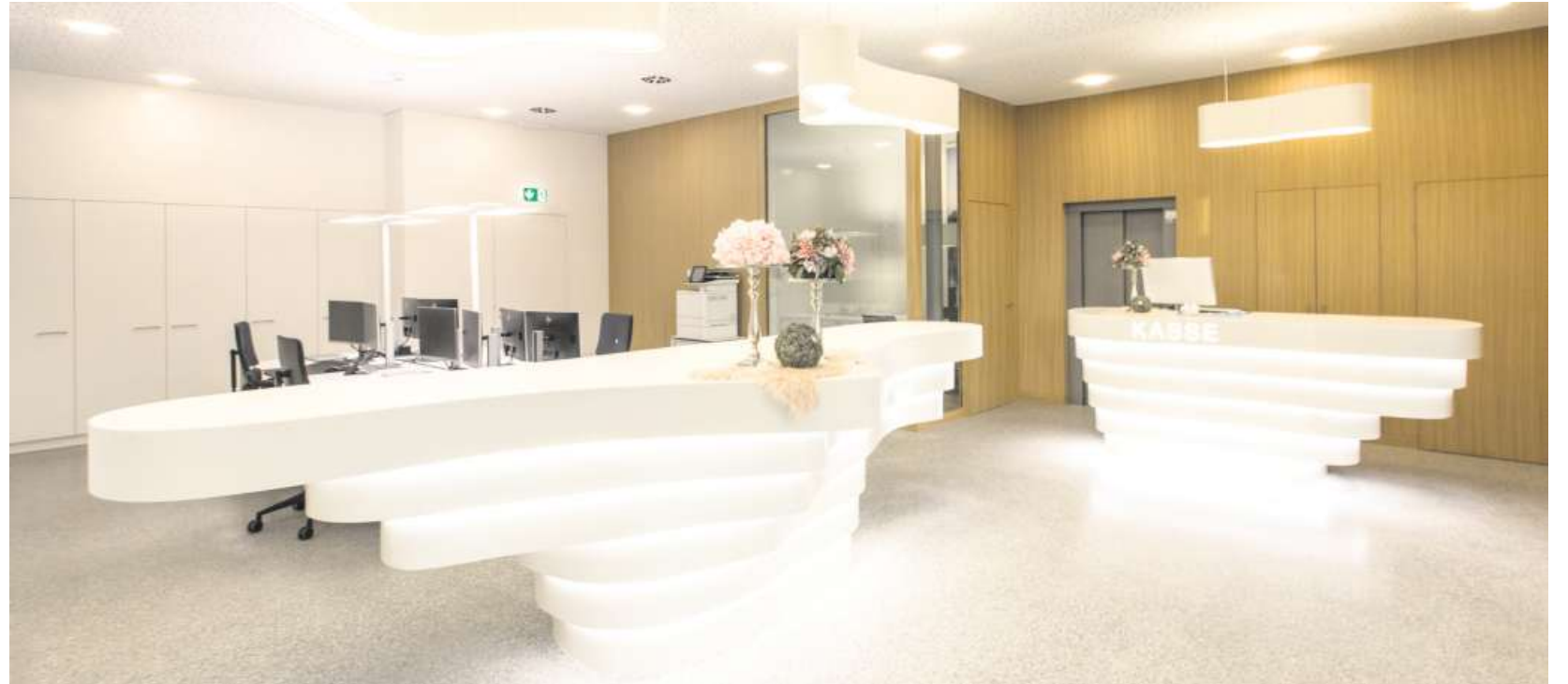
Der einladende Empfangsbereich steht für eine zeitgemässe, offene und kundennahe Bank.

trav und Eisengitterabschluss ist von der weissen Glas-Metallkonstruktion befreit und steht wieder frei vor der Fassade. Der Windfang, der neu als 24-Stundenzone für Bankgeschäfte zur Verfügung steht, befindet sich nun wieder im Gebäudeinnern und nicht mehr unter dem Portikus. Die neugestaltete Eingangsf front mit den grossflächigen Schaufenstern und den bronzefarbenen Metallprofilen wirkt offen und einladend. Fassade, Fenster und Fensterläden wurden farblich abgestimmt, frisch