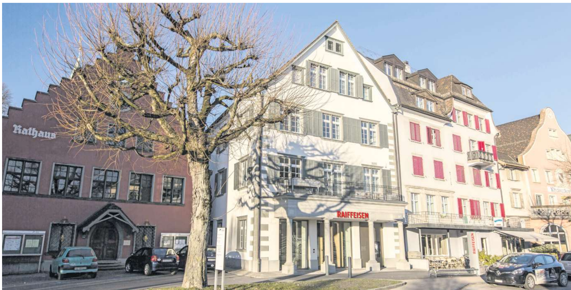
Die Raiffeisenbank wertet mit ihrer Haltung und Gestik die Häuserzeile der Rheinecker Bahnhofstrasse auf.