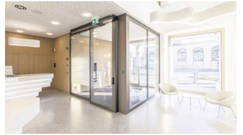
Die Bank ist regional verankert. Dies wird sichtbar in den weissen Theken, der Beleuchtung und den Glasflächen. Sie visualisieren die Höhenlinien der entsprechenden Gemeinden.